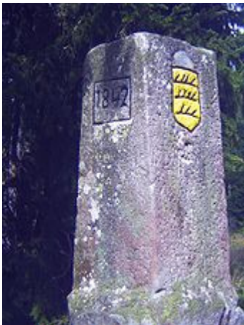
Alter württember- gischer Grenz- stein